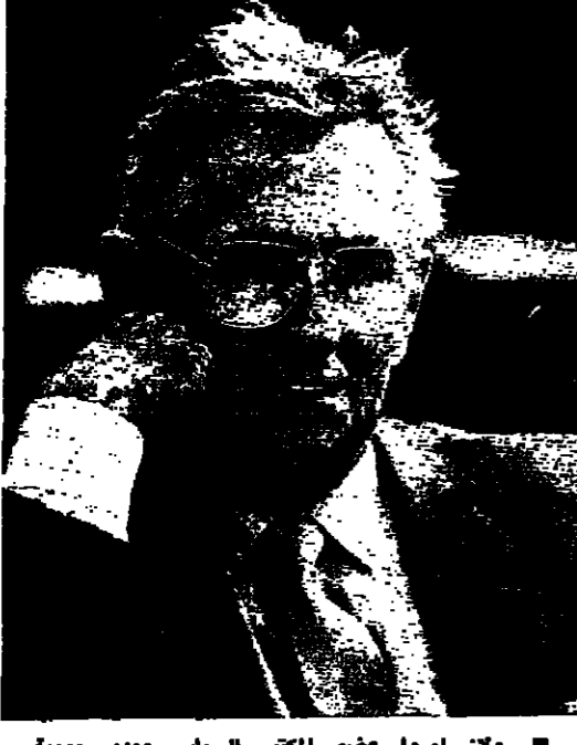
رولان لوروا عضو المكتب السياسي ومدير يومية الأوميتيه.